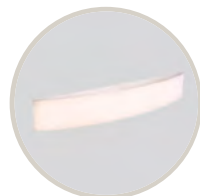
BLANCO / WHITE