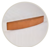
CEREZO / CHERRY