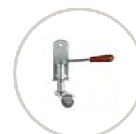
RUEDA / CASTOR 86 PUNTOS / 86 POINTS